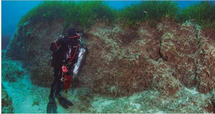
Posidonia oceanica matte.

Step 5. Calculate mean and standard deviation of carbon stocks for each stratum.