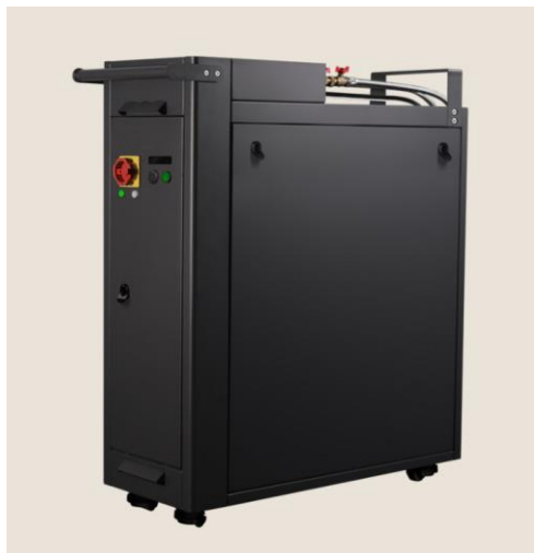
Figure 1 : Chaudière numérique de type QB

La chaudière numérique de type QB contient des serveurs informatiques et peut fournir une puissance qui dépend du matériel informatique installé, jusqu'à plusieurs kW par modules selon les configurations. Les performances en termes de température et de puissance dépendent du matériel informatique utilisé. L'appoint et les éventuels circulateurs ne sont pas intégrés à la chaudière numérique de type QB qui est parfaitement passive. La chaudière numérique de type QB est uniquement une source de puissance.