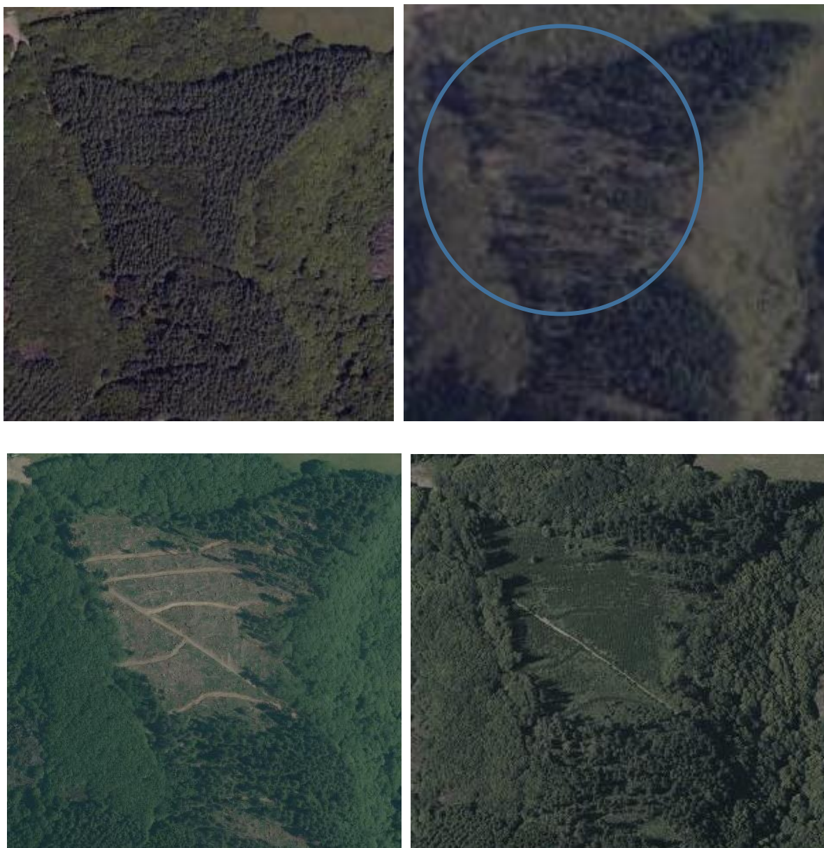
FIGURE 2. — Photographies aériennes d'un peuplement de douglas avant tempête en 2006 (photo en haut à gauche), après passage de la tempête Klaus de 2009 (en haut à droite : on devine les arbres jonchant le sol), après vidange des chablis en 2010 (en bas à gauche : on voit les tires de débarbage) et quelques années après reboisement en 2013 (en bas à droite). Extraits d'orthophotos issus de https://remonterletemps.ign.fr (Source : IGN)

Klaus 3,4 . Ce seuil est maintenu pour cette Méthode. Pour ce faire, le Porteur de projet devra faire une estimation de l'ampleur des dégâts survenus dans sa parcelle afin de savoir s'il est éligible ou pas. Les photographies aériennes peuvent suffire pour cette estimation.