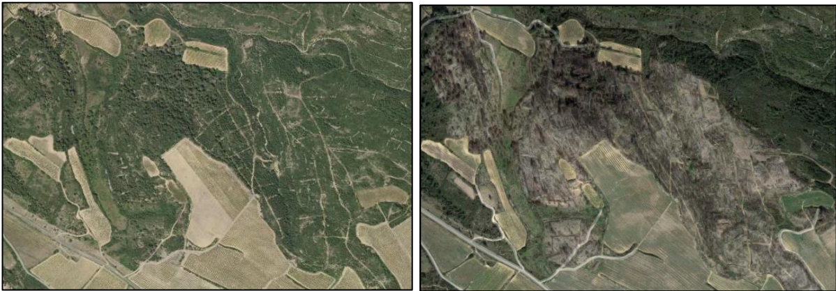
FIGURE 1. — Photographies aériennes d'une peuplement avant incendie (à gauche) et après incendie (à droite).

Le Porteur de projet devra calculer la surface à boiser, en ôtant les surfaces n'ayant pas été ravagées par l'incendie.