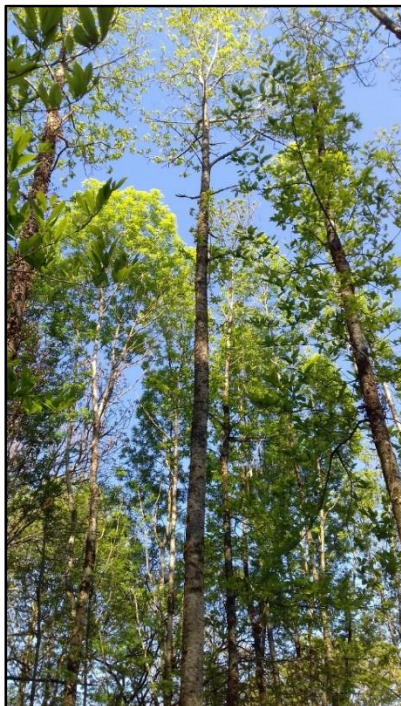
PHOTO 3. — Magnifique châtaignier issu du balivage ; il s'agit de la seule tige restante sur la souche. Pour désigner le peuplement, on peut désormais parler de futaie sur souches

On désignera par « futaie sur souches » un peuplement forestier feuillu issu du vieillissement ou de la régularisation d'un taillis (par balivage intensif), comportant une forte proportion de tiges issues de rejets de souches et ayant l'aspect d'une futaie.