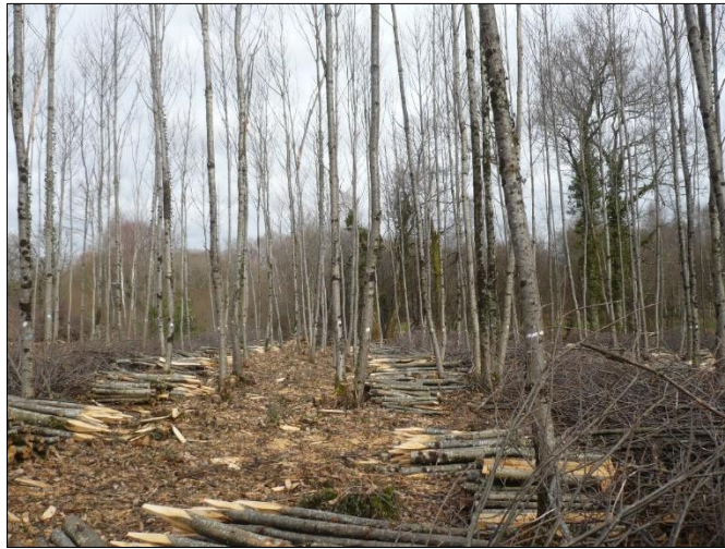
PHOTO 2. — Taillis de châtaignier après l'opération de balivage

Dans la suite, on parlera de « balivage » pour désigner l'éclaircie d'un taillis simple en vue de le convertir en « futaie sur souches », au profit des plus belles tiges appelées « baliveaux » préalablement sélectionnées grâce à un martelage ou un marquage.